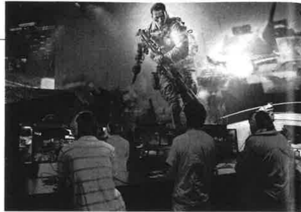
東京ゲームショウ2013で披露された新作のオンライン戦闘ゲーム。遭遇する敵を小銃などの武器で倒す。

厚生労働省研究班（代表・大井田隆日本大学医学部教授）の調査によって、2013年8月、ネット依存に陥っている中高生は51万8000人という推計値が報道された。このアンケート調査は、12年10月～13年3月、全国の中学校140校と高校124校で生徒約14万人を