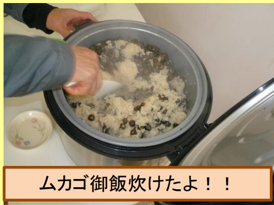
ムカゴ御飯炊けたよ！！