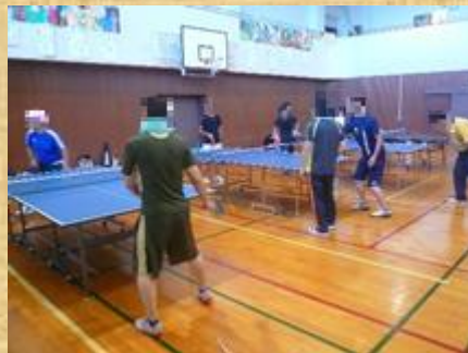
フリースタイル卓球中！！