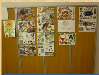
個性的な コラージュたち