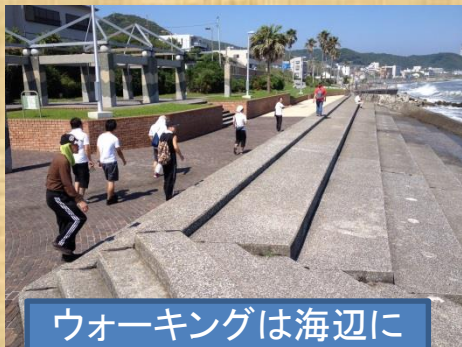
ウォーキングは海辺に限る！！