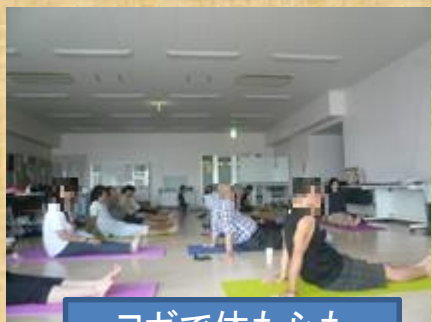
ヨガで体も心も リラックス