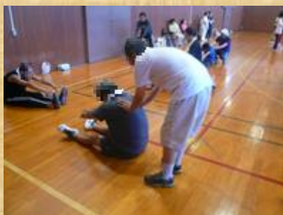
最近体やわらかくなった？