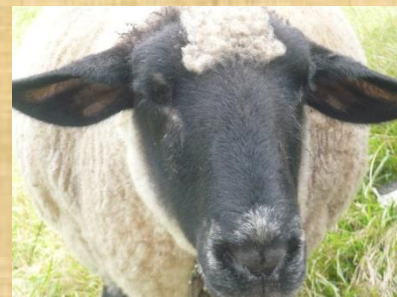
おメーら 何見てんだ！