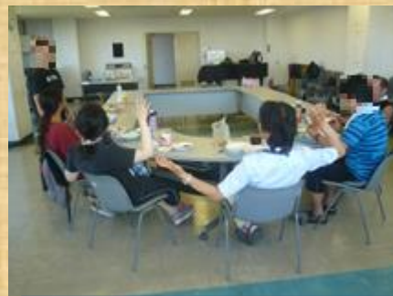
食事のあとも「ゆるゆる」と