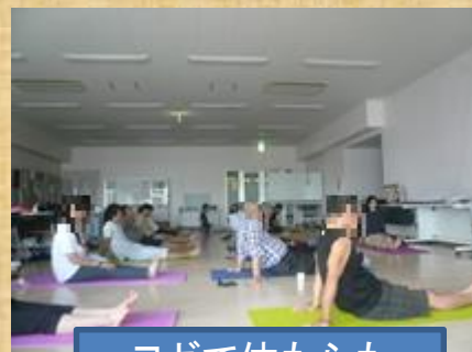
ヨガで体も心も リラックス