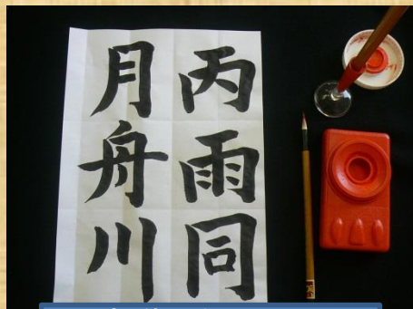
書道で集中力と 文字力強化