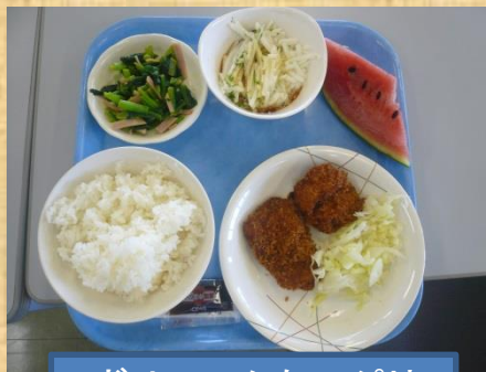
ボリュームたっぷり おいしそう