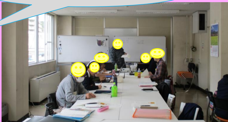
オフィスワークの様子(上)