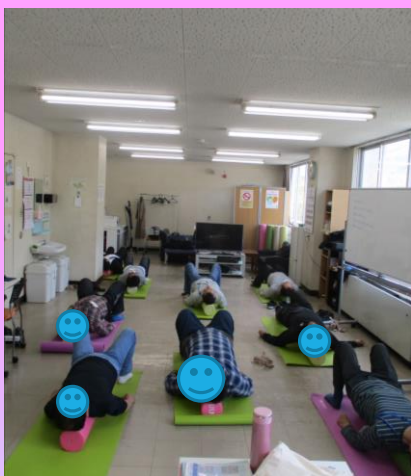
ポールストレッチ(上)、SST (右)